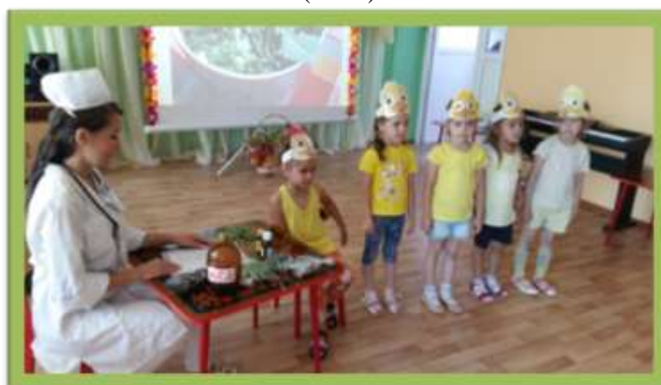
7. Развлечение «День здоровья» (2018)