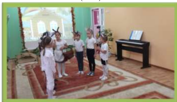
6. Развлечения «Лесная аптека» (2018)