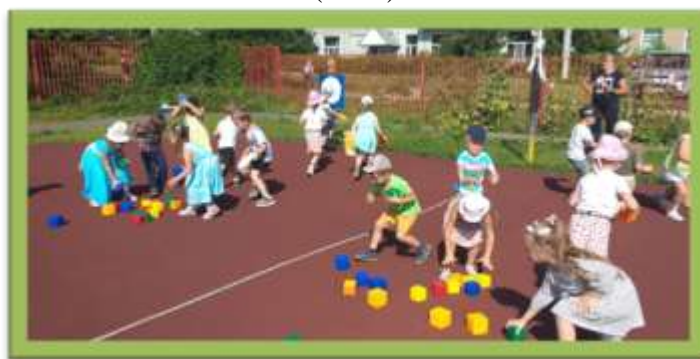
5. Развлечение «Осторожно, чужой!» (2017)