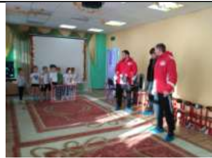
4. Развлечение «Лето красное - для отдыха прекрасное!» (2018)